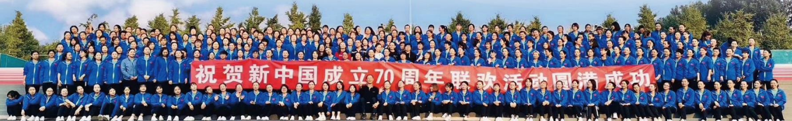
新中国70周年大庆志愿者